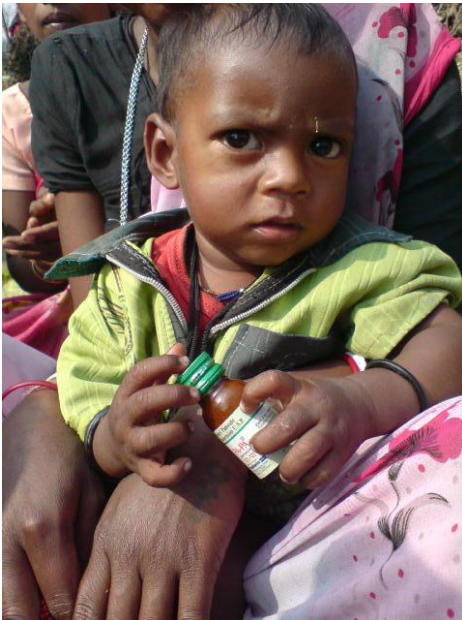
Mor og barn som nettopp har fått bendelorm kur.